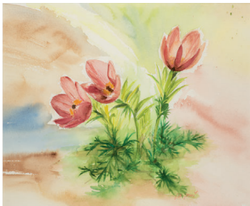
KONIKLEC akvarel | 2020

Silvestrovský večer, namísto oslav pohodička u barviček. Netuším, že si zakládám na silvestrovskou tradici.