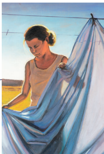
VĚŠENÍ PRÁDLA olejomalba | 2019

Sušící se cibule, večerní světlo, pár odstínů barvy, oddechovka.