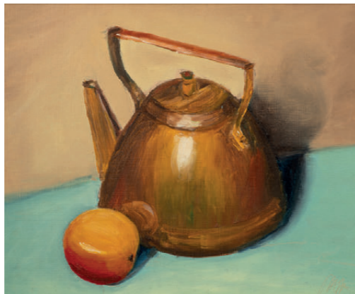
MĚDĚNÁ KONVIČKA OLEJOMALBA | 2019

Silvestrovský večer, namísto oslav pohodička u barviček. Netuším, že si zakládám na silvestrovskou tradici.