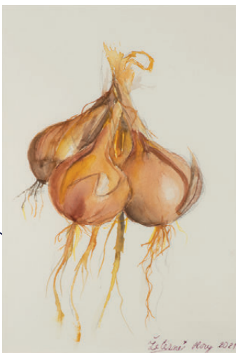
CIBULE akvarel | 2022

Poprvé maluji reálné zátiší, bez podmalby, a taky jsem ještě dosud nikdy nepoužila jako podklad destičku. Jak se bez zlaté barvy dá namalovat zlatá?